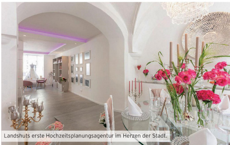
Landshuts erste Hochzeitsplanungsagentur im Herzen der Stadt.

Nahensteig 182a | 84028 Landshut Tel. 0871 - 97 47 46 55 Agentur-Feenstaub@t-online.de www.hochzeitsplanung-landshut.de und www.events-landshut.de